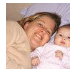
Ma fille , ma ... titoune1709