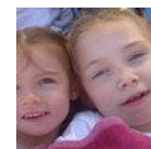
Mes deux anges et ... vivibande