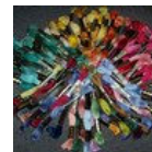
les xxx de ceje enzoemma